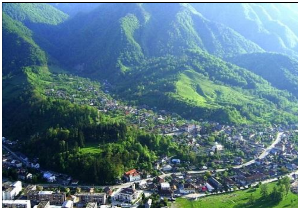
Foto. 1 Încadrarea orașului Brezoi în Depresiunea Loviștei

Ion Conea definește Depresiunea Loviștei ca pe „o lume aparte – părănd a fi un fragment din regiunea colinelor, transpus în inima munților” 2 . „Cea mai mare parte a depresiunii este cuprinsă între treptele de nivelare de 600-800- 1000 m” 3 . Valea Lotrului, Bazinul Brezoi-Titești și lărgirea Căineni sunt câteva exemple.